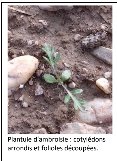
Plantule d'ambrosie : cotylédons arrondis et folioles découpées.

Pour une organisation optimale, merci de vous inscrire auprès d'Anne-Marie DUCASSE-COURNAC : am.ducasse@fredonoccitanie.com