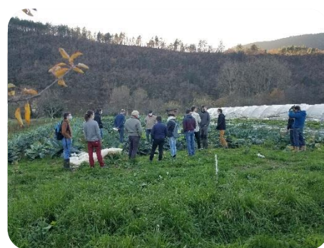
Groupe en formation Novembre 2020