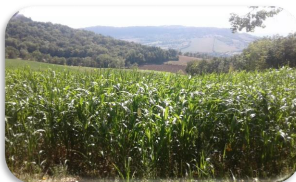
Expérimentation dérobées fourragères - parcelle de Sorgho

Les résultats de ces essais, menés depuis 2017 pour les essais variétés et depuis 2019 pour les essais de cultures à stock, sont disponibles sur le site de la Chambre d'Agriculture de Lozère (onglet productions & techniques).