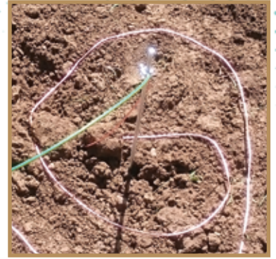
Tresse de cuivre en spirale pour améliorer la conductivité