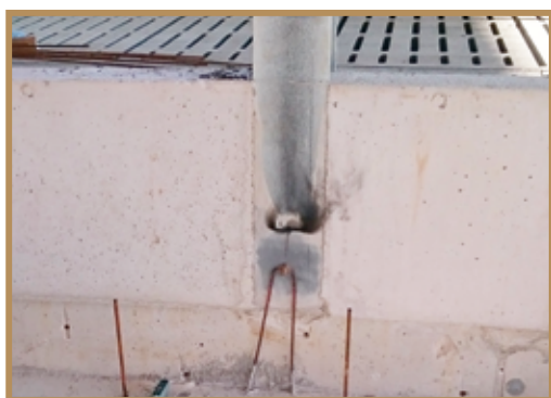
Soudure d'un poteau de charpente à la tresse de cuivre par aluminothermie