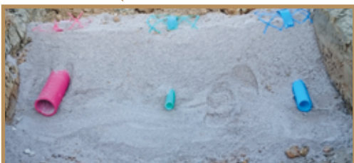
Tranchée de réseaux

Bon dimensionnement des tranchées : les tranchées d'amenée des réseaux d'eau, d'électricité, de téléphone, etc, peuvent être combinées en une seule tranchée à la condition que les canalisations électriques soient à au moins 20 cm de toute autre canalisation avec un matériau de remplissage de la tranchée peu conducteur (sable). Par précaution on peut conseiller de respecter un intervalle entre l'eau et l'électricité de 50 cm pour les tranchées > à 100 m de longueur. La profondeur de la tranchée ainsi que son éloignement d'éléments de voirie sont définis par la normalisation et dans tous les cas, ces canalisations sont protégées par la pose d'un grillage avertisseur dont la couleur permet de connaître la fonction : téléphone : vert , eau : bleu , électricité : rouge .