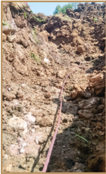
Bonne réalisation de boucle de fond de fouille

Un différentiel de sensibilité 30 mA complète ce dispositif afin de limiter les tensions de contact et éviter tout risque en coupant automatiquement le courant en cas de défaut sur un appareil.