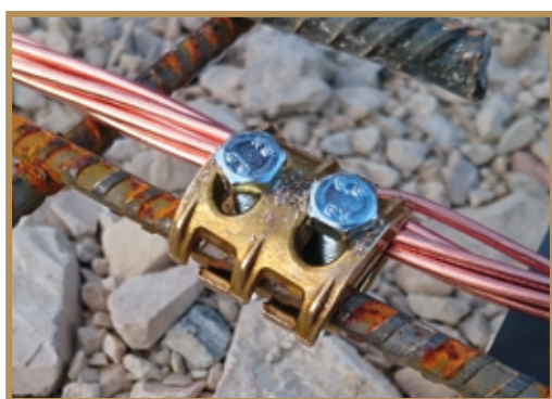
Pontet en laiton

Et il faut bien sûr relier toutes ces nappes de ferrailage à la terre réalisée par la boucle en fond de fouille. Un conducteur de cuivre assure cette liaison. La connexion se fait par pontet en laiton ou brasure.