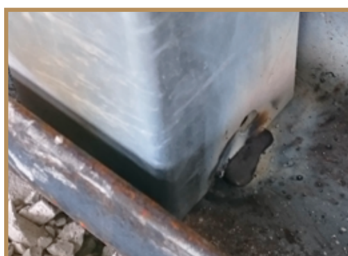
Détail de la soudure du poteau de logettes