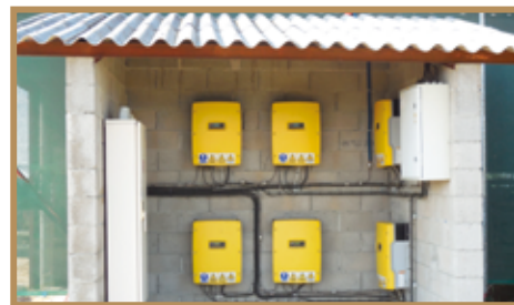
Onduleurs dans local hors du bâtiment