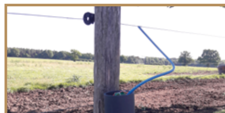
Connexion câble blindé au fil de clôture