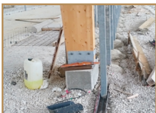
Poteaux de logettes soudés sur rail métallique