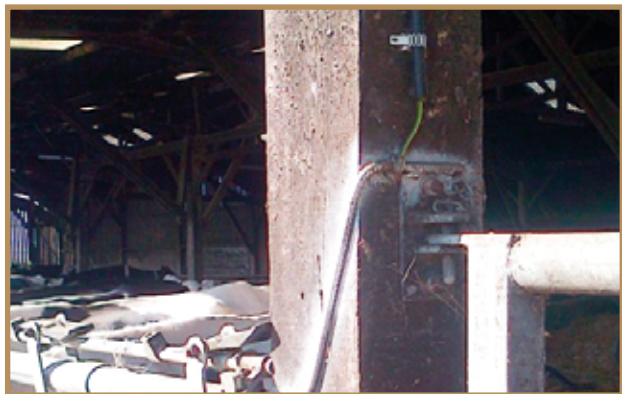
Mise en équipotentialité d'un cornadis

Il n'y a pas lieu de distinguer ces matériels quant aux précautions à prendre si ce n'est que ceux fonctionnant en milieu humide ou dans le lisier doivent faire l'objet d'une vérification de leur parfaite étanchéité aux liquides.