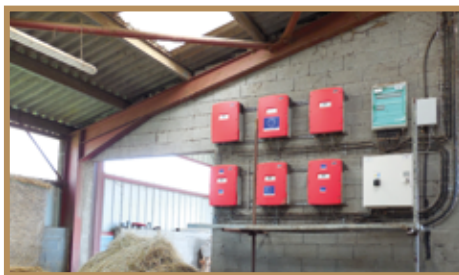
Onduleurs dans bâtiment