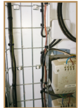
Chemin de câbles mis à la terre