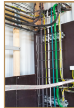
Chemin de câbles bien réalisé

Il faut privilégier le passage des câbles dans des chemins de câbles mis à la terre qui permettent aussi une meilleure lutte contre les dégâts commis par les rongeurs et qui facilitent les interventions ultérieures sur l'installation.