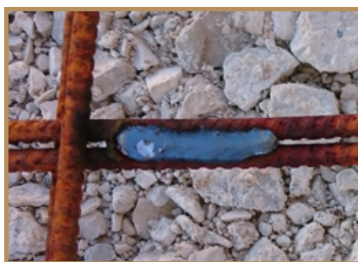
Cordon de soudure sur treillis