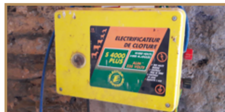
Poste de clôture avec câble haute isolation