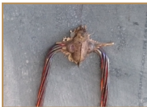
Détail de soudure par aluminothermie