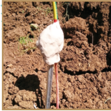
Protection de la connexion par du mastic

Lorsque la prise de terre existante par piquets n'est pas de qualité suffisante, (ou que la boucle en fond de fouille est implantée dans un terrain peu conducteur) on peut améliorer l'installation par la mise en place d'une prise de terre déportée comprenant au moins un piquet (respect de la norme NF 15-100) et si possible plusieurs piquets ainsi qu'une tresse de cuivre de grande longueur enfouie dans un sol de meilleure conductivité.