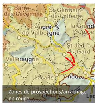
Zones de prospection/arrachage en rouge

De plus, un chantier d'arrachage a été effectué à Cendrars dans le Grave du Rieusset le 01/07.