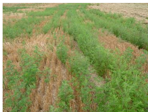
Levée d'ambrosies derrière un chaume. Il est temps ici de détruire l'interculture, avant fleurissement de l'ambrosie.