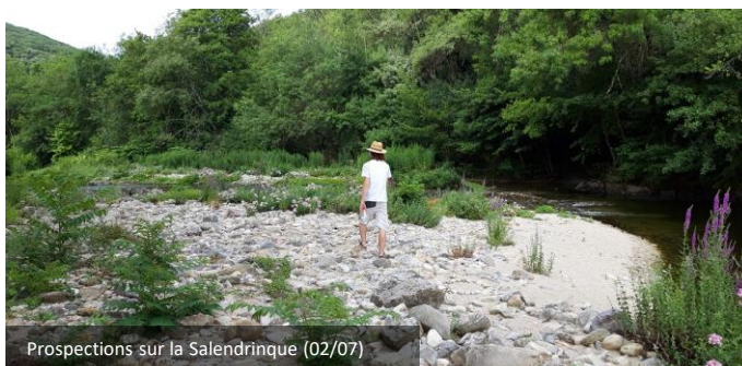
Prospections sur la Salendrinque (02/07)

Témoin l'infestation repérée (et gérée, à surveiller et re-gérer en 2020) à Pont-de-Montvert l'an passé suite à un transport de terres en chantier bord de route.