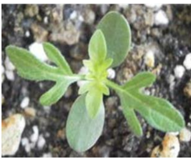
Plant d'ambrosie âgé d'une semaine

La reconnaissance de la plante aux stades précoces est un atout pour lutter rapidement et efficacement en milieu agricole ou en espaces verts.