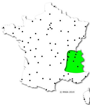
Figure 1 : carte des risques polliniques liés à l'ambroisie au 02/08/19 (données RNSA)

RNSA : Premiers pollens d'ambroisie sur certains sites de mesure en région Auvergne-Rhône-Alpes et dans le Nivernais.